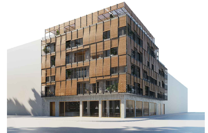
CALLE ARAGÓN 180 ESQUINA CON CALLE MARE DE DEU DE MONTSERRAT PALMA DE MALLORCA

LLEVANT PLANTA 1, 2, 3, 4 PUERTA 2 PLAZAS 6 HABITANTES SUPERFICIES APROXIMADAS